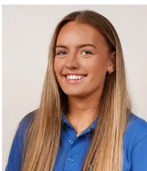
Arrangement Kristine Aase